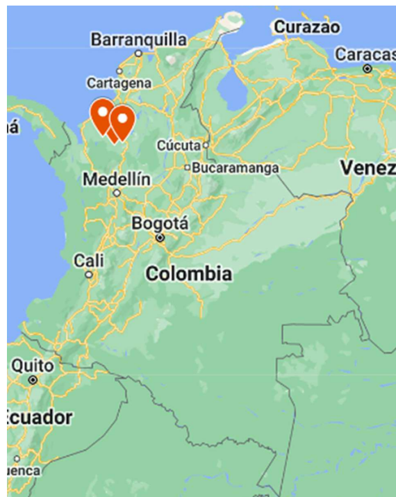
Ilustración 1 Localización de Puerto Libertador, Tierralta y Montelíbano en Colombia.

Los municipios de Puerto Libertador, Tierralta y Montelíbano son municipios colombianos, ubicados en el Departamento de Córdoba, cuya dedicación están enfocada en la agricultura, ganadería y la pesca, el municipio Puerto Libertador, se ubica en las coordenadas 7°53'17"N 75°40'18"O a 170 km kilómetros del Departamento, se fundó en 1941 y basó su economía en la agricultura, la ganadería y la minería, el municipio de Tierra alta, se ubica en las coordenadas 8°10'22"N 76°03'34"O a 78 kilómetros del municipio de Montería capital del departamento de Córdoba se fundó en 1909 y basó su economía en la producción agropecuaria, la ganadería vacuna, la extracción madera y la pesca y el municipio Montelíbano se ubica en las coordenadas 7°58'16"N 75°25'05"O a 114 kilómetros de la capital del Departamento, se fundó en 1907 y basó su economía en la pesca comercial, la agropecuaria y la explotación de riqueza natural.